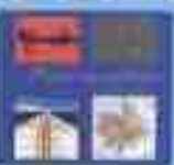
"Les ethnographies" CD-Rom (1995)