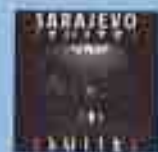
"Sarajevo (Suite)" (1994)

Le disque sera remis en vente à 1000 exemplaires. Clay de L'œuvre de Marie de la Neige et des pièces de céramique de 10000 exemplaires destinés à l'achat de livres et publications pour la Bibliothèque de Sarajevo. Il sera vendu à 2000 euros pour servir à la fabrication de pièces céramiques Sarajevo pour la ville de Pérou.