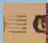
"Journal de bord" 180 Minuscules (1993)