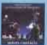
"Autres chansons" Adamo Drijan Les Hugissants de Sarajevo (1995)

Le disque sera remis en vente à 1000 exemplaires. Clay de L'œuvre de Marie de la Neige et des pièces de céramique de 10000 exemplaires destinés à l'achat de livres et publications pour la Bibliothèque de Sarajevo. Il sera vendu à 2000 euros pour servir à la fabrication de pièces céramiques Sarajevo pour la ville de Pérou.