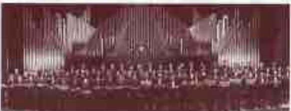
Chœurs de l'Orchestre National de Lyon